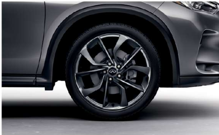
INFINITI QX50 Sensory. Aros de aleación de aluminio de 20", 255/45R20 Run Flat Summer Season.