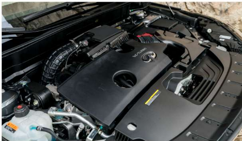
INFINITI QX50 Luxe. 27% más rendimiento en comparación con un auto convencional.