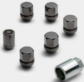
#T99W2JT010 / JUEGO DE 4 PIEZAS