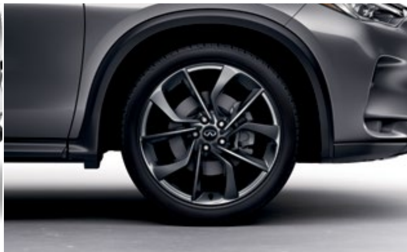
INFINITI QX50 Sensory . Rines de aleación de aluminio de 20", 255/45R20 Run Flat Summer Season.