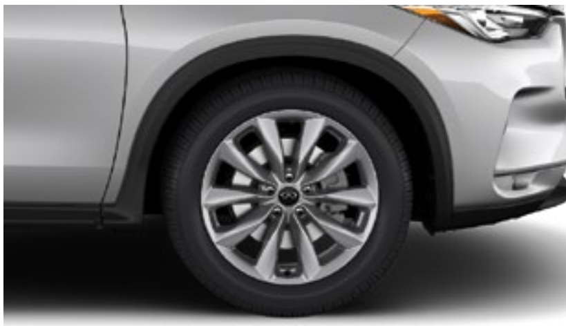
INFINITI QX50 Luxe e INFINITI QX50 Essential . Rines de aleación de aluminio de 19", 235/55R19 Run Flat Summer Season.